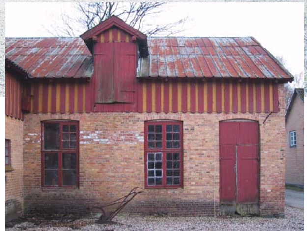
Det er på høje tid at komme igang med restaureringen af møllehuset.

Tre bygningsafsnit på Vestermølle fik i 2002 af arkitektfirmaet Gert Bech-Nielsen prædikatet Høj bevaringsværdi. Det er Bygning 5 Laden, møllehuset i Møllebygningen Bygning 3 og Riddersalen. Siden er Riddersalen blevet fredet af Kulturarvstyrelsen.