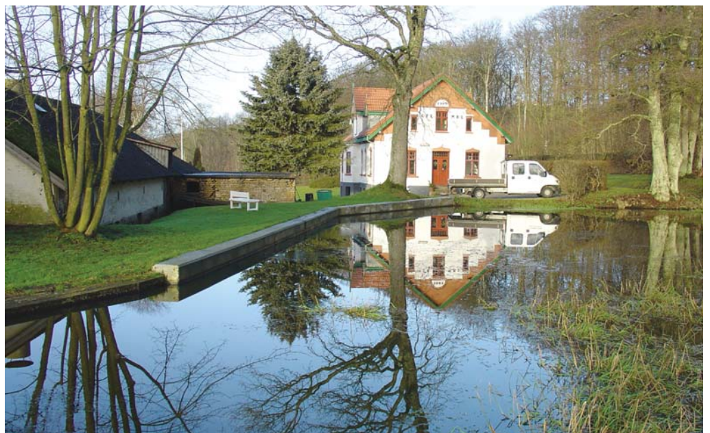
Møllebygningen til venstre. Den ny hovedbygning spejler sig i Mølledammen.