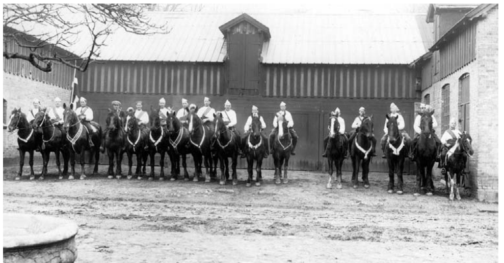
Fastelavnsryttere fra Fruering-Hvolbæk foran den dengang nyopførte møllebygning i 1912.

Møllehuset med høj bevaringsværdi er opført i en let flammert gul tegnsten. Inde i bygningen er der drivaksler og møllerimaskiner af høj værdi. Turbinen under vandfaldet fra mølledammen er måske ikke så romantisk som et møllehjul, men betegnes til gengæld som industrihistorisk interessant.