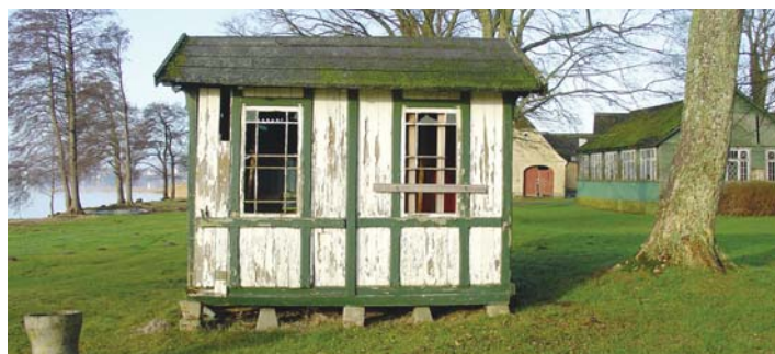
Keglehuset kan ikke restaureres. Et nyt må bygges efter mål. Bemærk Riddersalen til højre i billedet.

Arkitektfirmaet Frost Larsen anslår en sum på 1,8 millioner kroner inklusive moms i 2007-priser.