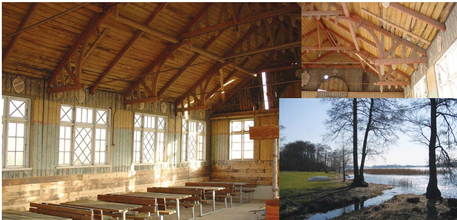
Også indvendig ses det at Riddersalen er en arkitektonisk perle. Indsat Møllebækkens udløb i Skanderborg Sø.

Fredede bygninger repræsenterer det ypperste af dansk bygningskultur og udgør en vigtig del af kulturmiljøet, hedder det i forordet til pjecen Når bygningen er fredet , udgivet af Skov- og Naturstyrelsen i 2000.